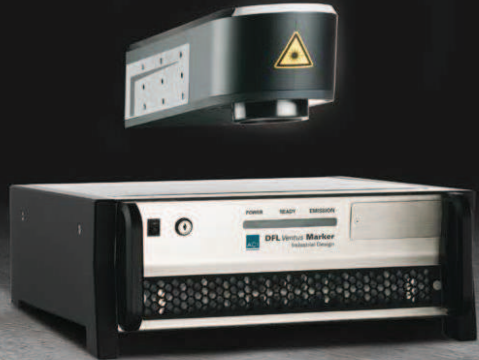
Ilustración con paneles laterales opcionales